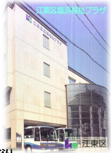
江東区塩浜福祉プラザ

ほんかん ていいん めい きば ぶんしつ ていいん めい かいせつ を本館(定員40名)とし、木場に分室(定員20名)を開設する。